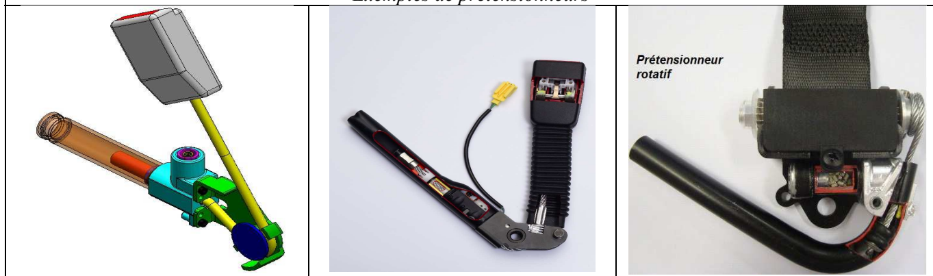
Exemples de prétensionneurs

Dispositif additionnel ou intégré qui met sous tension la sangle de la ceinture de sécurité afin de réduire le jeu de celle-ci au cours d'une série de chocs.